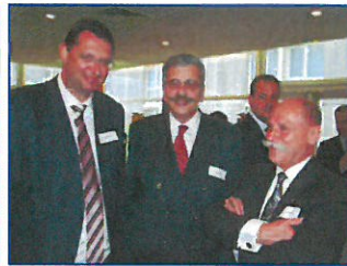
Directeurs Belges et Luxembourgeois