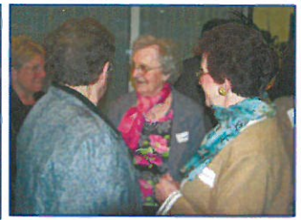
Retraitées du Novotel Lille Aéroport