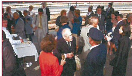
Visite à quai en Gare de Paris Bercy du Pullman Orient Express, fleuron du patrimoine de la Compagnie des Wagons-Lits