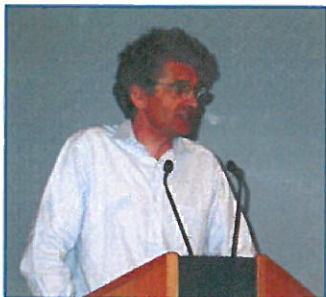
Monsieur le Président,

Nous mesurons à sa juste valeur la chance de vous rencontrer ce soir pour nos 22 èmes Rencontres Trait d'Union à Paris, et je voudrais, avant tout, vous remercier chaleureusement pour l'intérêt que vous portez à notre Association et pour l'enthousiasme avec lequel vous avez accepté notre invitation.